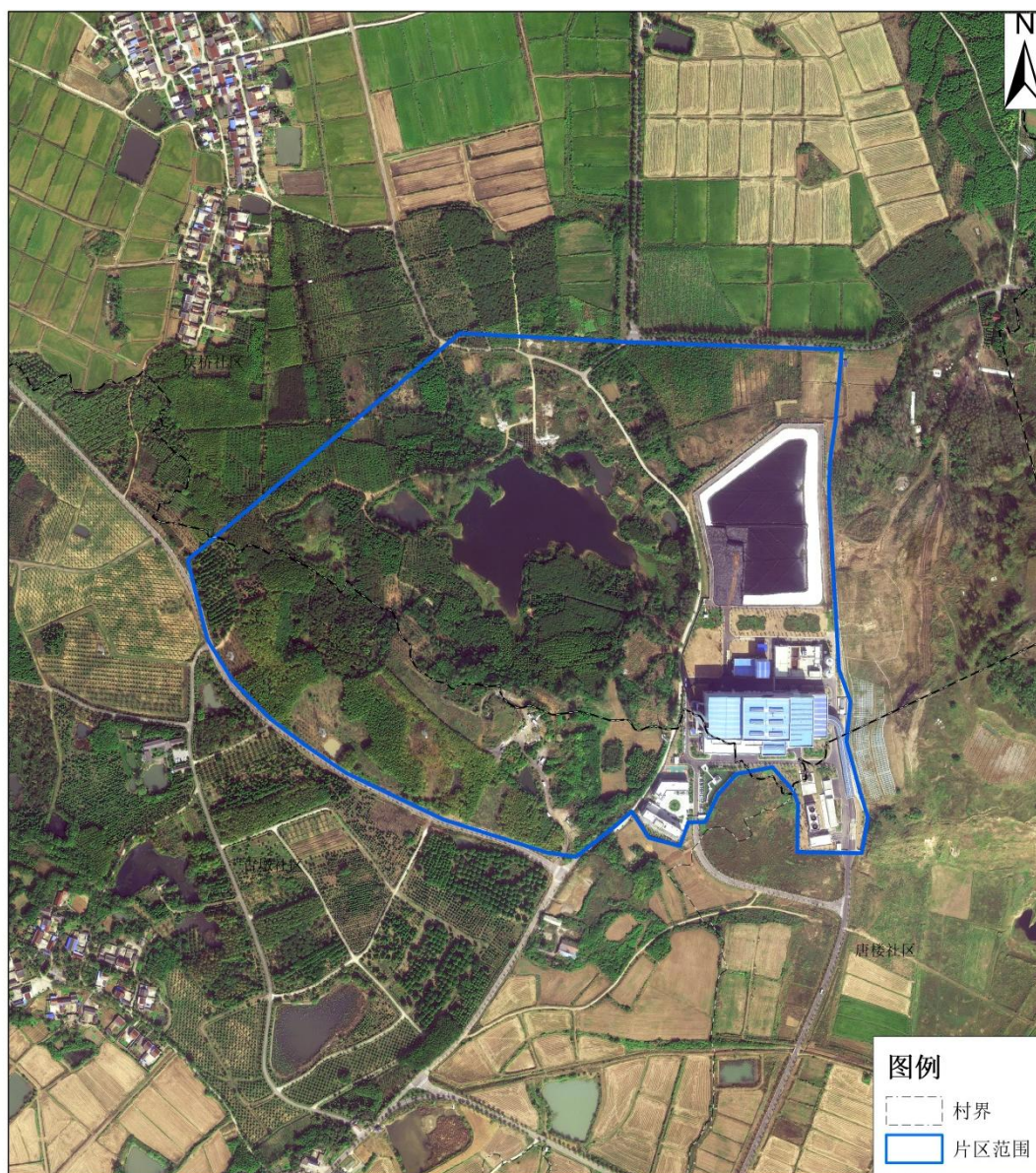
片区范围示意图一

1、《六合区循环经济产业园片区土地征收成片开发方案》符合自然资源部土地征收成片开发的标准，做到了保护耕地、维护农民合法权益、节约集约用地、保护生态环境，能够促进社会经济可持续发展。